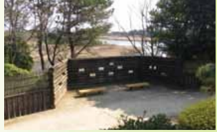
四季折々の野鳥の姿を観察できます