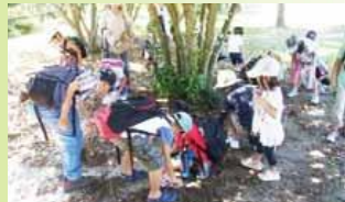
植物や昆虫などの観察も楽しいですよ