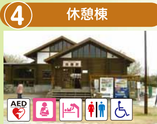
ご自由にご利用ください