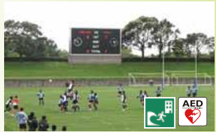
サッカー・ラグビー以外の競技にも利用可能です