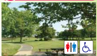
緑の芝生のきれいな広場、ピクニックにも最適