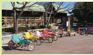
子供用自転車や一輪車の練習ができます