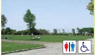
多目的にご利用できる芝生広場 サブグラウンドとしても利用可能です

天然芝球技場 観客収容人数/12,500人 (固定3,700人、芝生8,800人) 更衣室、役員室、審判員室、 会議室、便所等 フィールド/154m×88.5m